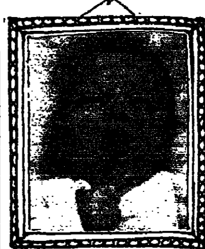
بمدير أمن جدة المكلف

● سجن الحجة - تم تحويل سجن الحجة من مديرية أمن جدة إلى مديرية أمن مكة المكرمة. وذلك في إطار عملية إعادة تنظيم السجون في المملكة العربية السعودية. ● مدير أمن جدة - تم تعيين مدير أمن جدة الجديد. وذلك في إطار عملية تجديد الكوادر الأمنية في المنطقة. ● مدير أمن مكة - تم تعيين مدير أمن مكة الجديد. وذلك في إطار عملية تجديد الكوادر الأمنية في المنطقة.